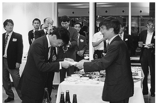
優秀研究企画賞（2008年富士電機賞）の2009年会における表彰式風景