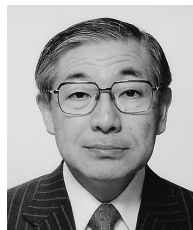
花本啓祐（はなきけいすけ） 東京大学大学院工学系研究科・サステイナビリティ学連携研究機構 教授

同大学サステイナビリティ学連携研究機構（IR3S）教授（兼任）（2005年10月～）