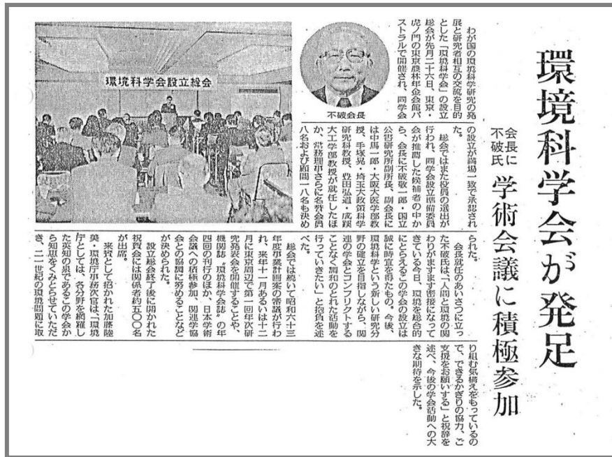
環境公害新聞 掲載記事 (1987 年 12 月)